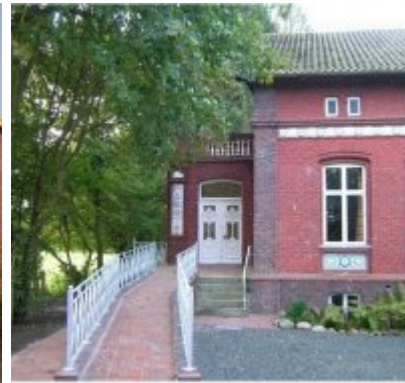
Hof (10 - 12 Pers.)