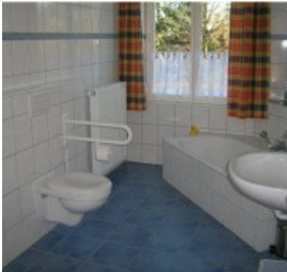
Hof (10 - 12 Pers.)