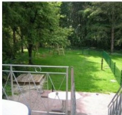
Hof (10 - 12 Pers.)