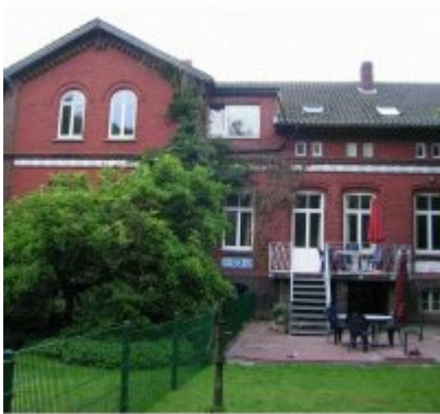
Hof (10 - 12 Pers.)

Liebe Urlauber, wenn Sie Ihren Urlaub, Ihre Ferien an der Nordsee - in Varel verbringen möchten, dann sind Sie hier richtig.