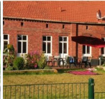
Hof (12-15 Pers.)